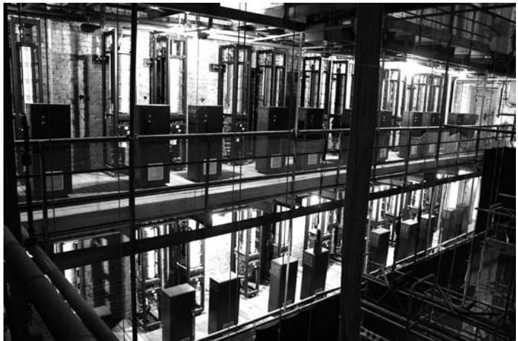
Парк светового оборудования Государственного театрально-концертного зала, Грозный