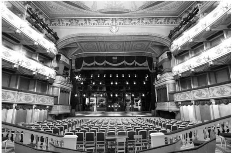
Сорок беспротивовесных лебедок - новая механика Пермского академического театра драмы.