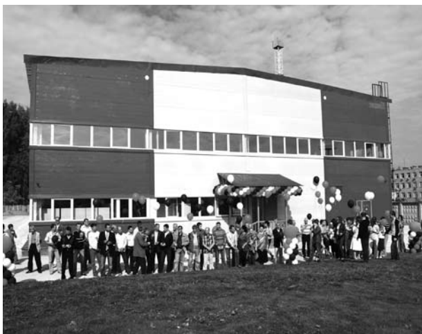
Новое производственное здание фирмы "Система"